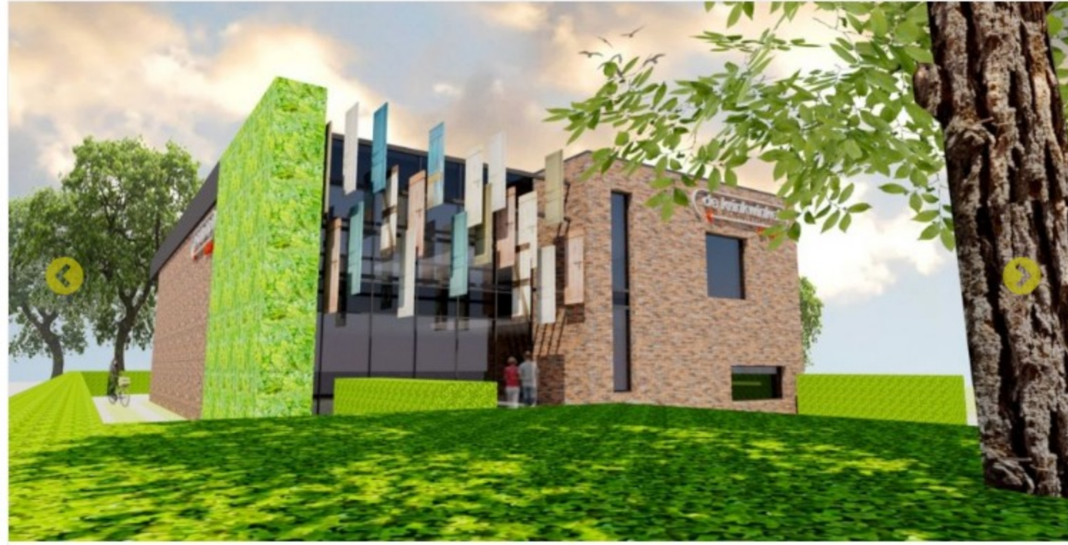
ILLUSTRATIE | BURO B